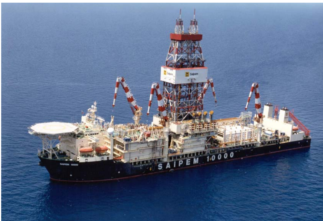
Figura ES.2 Saipem 10000.

Cova-1 ne'e planeia ona atu halo serbisu perfurasaun iha fulan-Setembru 2010 nu'udar esplorasau vertical ida. Perfurasaun ne'e sei utiliza ró-fura nian, Saipem 10000 (Figura ES.2). To'o mai iha lokál, ró ne'e-fura nian ne'e sei liuhosi nia pozisaun no hela iha pozisaun ne'e utiliza sistema Posisionamentu Dinámiku Klase III.