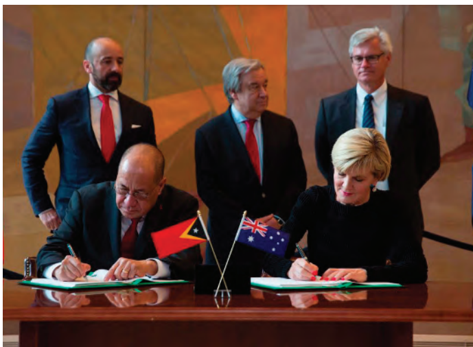
Reprezentante ba Timor-Leste iha Konsiliaun, Ministru Agio Pereira asina Tratadu Fronteira Marítima ho Austrália nia Ministra Negósiu Estratejiru Julie Bishop iha Sede Nasoens Unidas nian, Nova lorke, iha lora 6 fulan-marsu tinan 2018

Governu Timor-Leste hahú konsiliaun obrigatoria tuir Nasoens Unidas nia Konvensaun ba Lei Tasi nian iha fulan-abril tinan 2016. Hafoin disputa ne'ebé naruk, Timor-Leste hahú prosesu ne'e hodi lori Austrália ba meza negosiasaun nian, atu nune'e nia bele hetan nia direitu soberania no hetan fronteiras marítimas permanente iha Tasi Timor. Hili hakat ida ne'e, TimorLeste sai nasaun dahuluk hodi utiliza mekanizmu ida ne'e tuir Konvensaun.