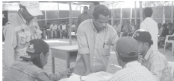
Halo Asemblea Jeral Militantes

kohi Fretilin atu ukun. Fretilin presija aprende husi esperiensi hodi haforsa liutan partidu Fre-