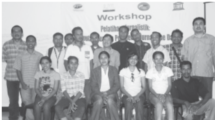
Partisipantes workshop jurnalizmu paz

saun media nasional iha Timor Leste atu halo kobertura iha konfliktu laran. Jornalista sira hato'o katak maioria media halo kobertura saida maka akontese maibe la hare klean impaktu husi konfliktu ne'ebe afeitá