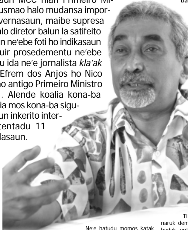
Ne'e hatudu momos katak atu taka buat ruma.

Primeiru MCC tenke ijji governu AMP para hatudu sira nia transparénsia tanba governu AMP laiha transparénsia, sira halo sasán hotu-hotu ho klandestinu deit, no konfidensial. Konkursu sosa karreta ba Parlamentu mos dehan konfidensial. O uza es-tadu nia osan, uza povu nia osan para sosa karreta dehan konfidensial. Iha rai balun so konfidensial ne'e kuandu sasán ne'e mai ba seguransa de es-tadu nian. Ida ne'e maka admitti konfidensial, biar nune'e laos sasán hotu-hotu.