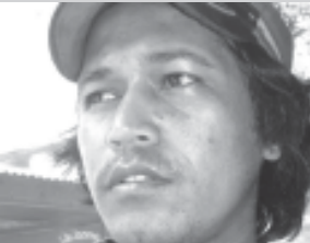
Fres, sasin nain ba Masakre 6 Setembre Suai