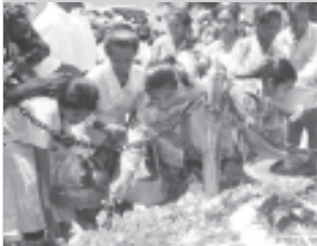
Familia Vitima tau aifunan

Maske masakre nakukun 6 Setembre 1999, ne'ebe akontese iha tinan sanulu liu ba ne'e seidauk lori suspeitu ruma ba tribunal internasional. Maibe familia vitima sira ne'ebe mak kla'ak hasoru iha Suai, kuaze hotu-hotu hatan katak tenki loka tribunal internasional ba masakre ne'ebe akontese iha Timor-Leste antes no depois referendum 1999. ■