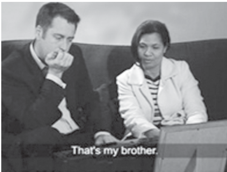
That's my brother.